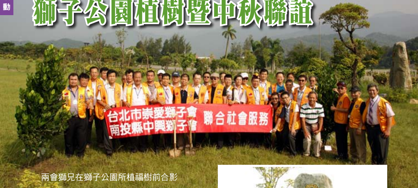
兩會獅兄在獅子公園所植福樹前合影