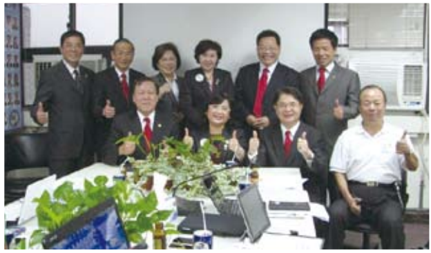
代表A2區參加複合區培訓