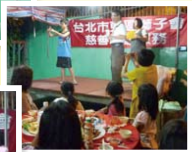
院童們進行比手劃腳 猜成語比賽