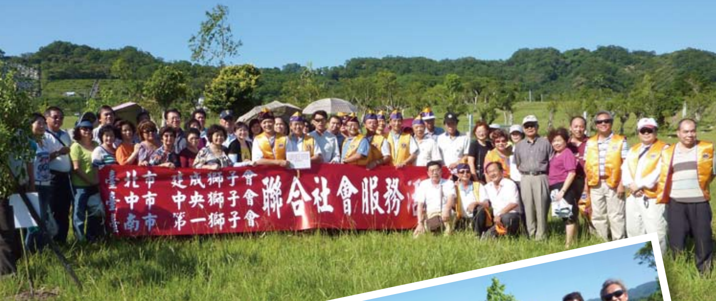
全體獅友聯合植樹社服合影