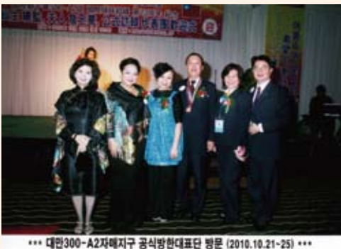
*** 대관300-A2차메지구 공식방한대표단 평문 (2010.10.21-25) ***