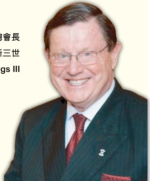
國際總會長 西得史古洛格斯三世 Sid L. Scruggs III