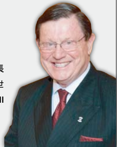
國際總會長 西得史古洛格斯三世 Sid L. Scruggs III

若還未完成，希望您多鼓勵區內至少50% 以上分會參與前面一項運動及保護我們的環境之全球服務行動運動。若能頒發越多光芒守護獎，我將更快樂。