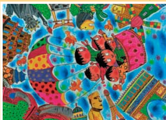
佳作 洪楷軒 興雅國中(愛華)