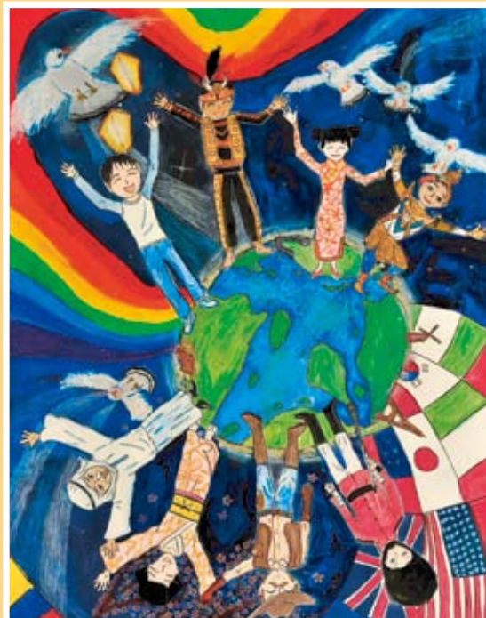
佳作 洪晨瑜 光復國小(文山)