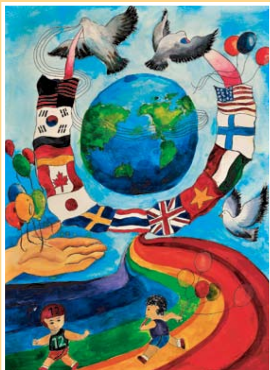
佳作 翁瑞隆 新埔國中(榮華)