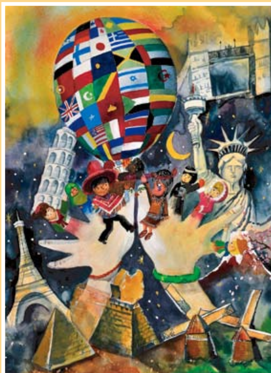
佳作 陳芷鈴 景興國小(德馨)