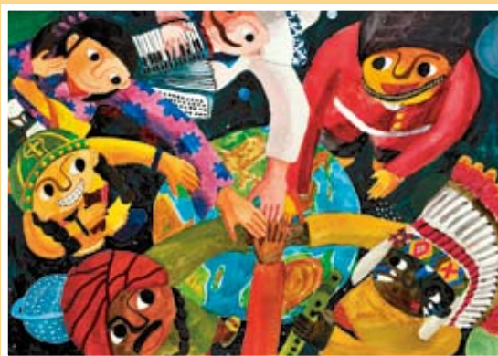
佳作 陳奕嬭 健康國小(松鶴)