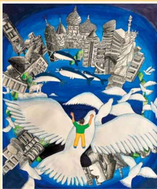
佳作 黃翊寧 鷺江國中(千禧)