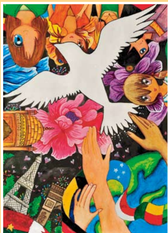
佳作 劉庭妤 中正國小(福爾摩薩)