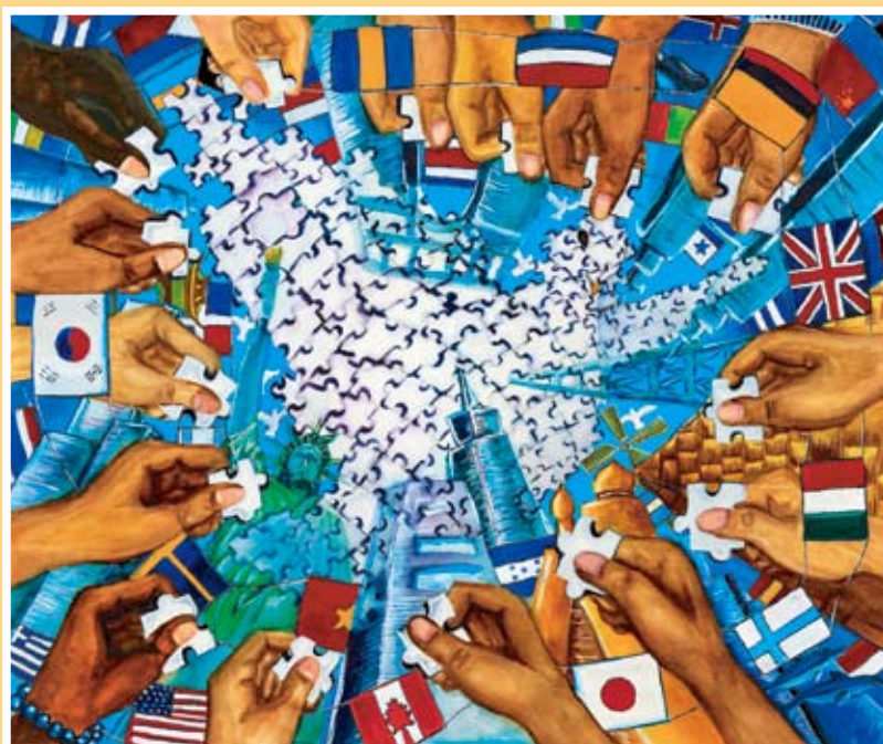
第一名 徐妍蓁 古亭國中(長江)