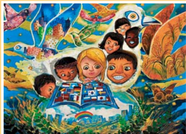
第三名 萬丹雅 北安國中(菁英)