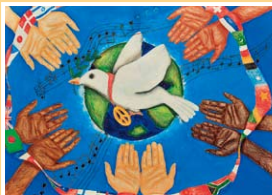
佳作 李青芳 金華國小(崇德)